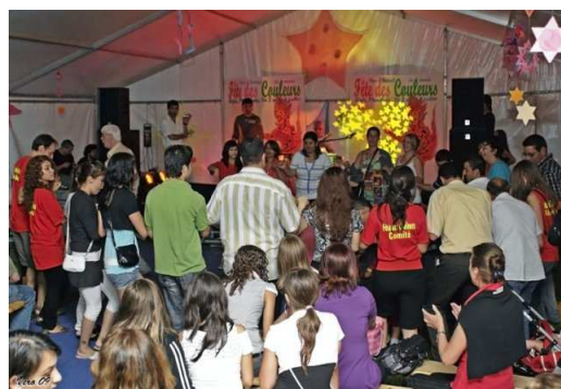
Moments de détente entre les spectateurs et les bénévoles