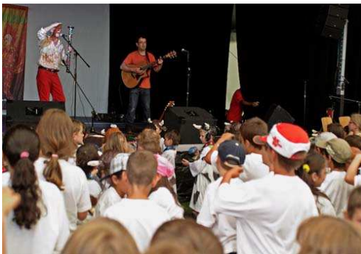
Spectacle offert aux enfants

Pour cette 10ème édition , notre programme de partenariat et sponsoring vous propose de soutenir directement une animation ou un concert précis. Ou comme les années précédentes, nous soutenir plus globalement.