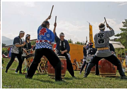
Les « artistes de rue » NT2 & L'Ecole du Japon ont animé la fête 2009