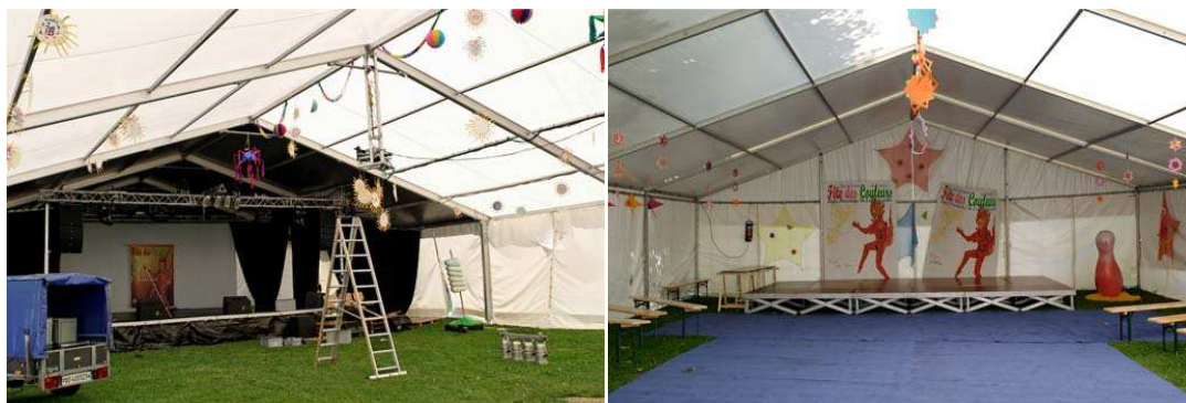
Installation des Scènes « Soleil » & « Etoile » juillet 2009