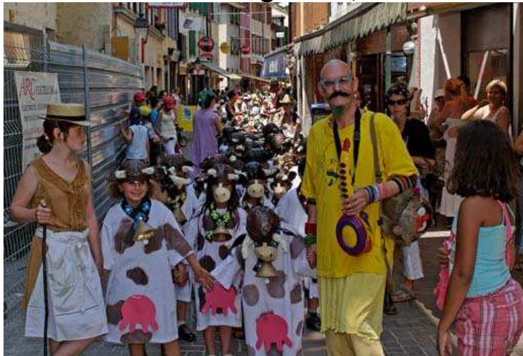
Cortège des enfants traversant la ville d'Aigle

De fête de quartier, la Fête des Couleurs est bien devenu Festival du monde et a pris une dimension régionale, voir cantonale.