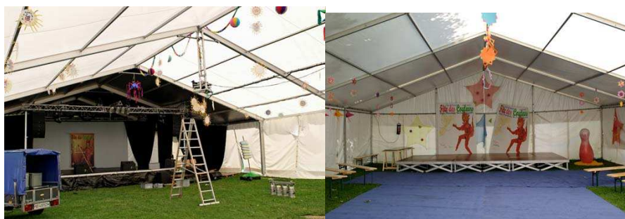
Installation des Scènes « Soleil » & « Etoile » juillet 2009