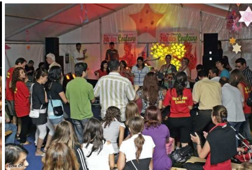
Moments de détente entre les spectateurs et les bénévoles

Le comité d'organisation de la Fête des Couleurs regroupe chaque année de nombreux bénévoles de différentes ethnies qui en assurent le bon déroulement.