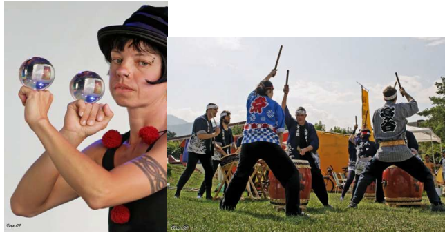
Les « artistes de rue » NT2 & L'Ecole du Japon ont animé la fête 2010