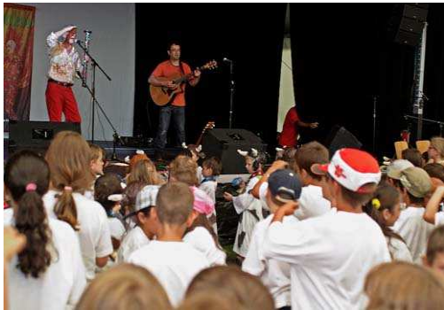
Spectacle offert aux enfants

Cette prise de conscience a fait du chemin notamment avec, depuis 2007, la participation des écoles d'Aigle au cortège auprès des artistes. De Fête de quartier, la Fête des Couleurs est bien devenu Festival du Monde et a pris une dimension régionale, voir cantonale.