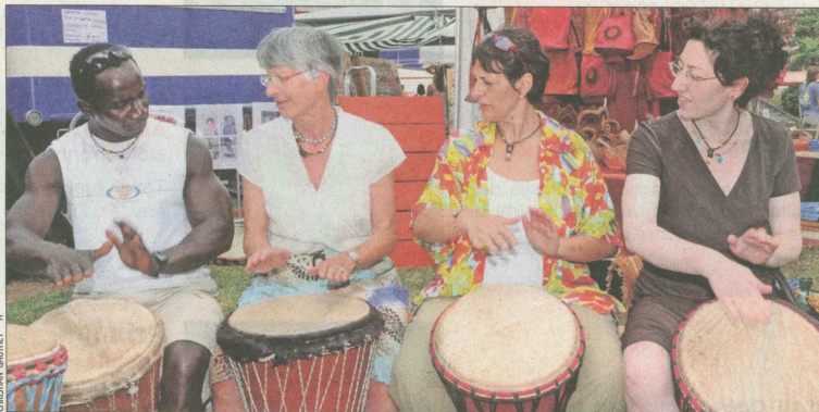
ENSEMBLE Pour de nombreux étrangers, la Fête des couleurs de la région d'Aigle constitue un pas important sur la voie d'une intégration en douceur.

Dans ce processus, la Fête des couleurs a joué un rôle déterminant. Dès l'an 2000, la jeune Kurde de Syrie, alors âgée de 12 ans, devient bénévole dans l'organisation de l'événement multiculturel du début de l'été, qui vivra sa neuvième édition les 3 et 4 juillet prochain. Il ne faut qu'une année à la gamine d'alors pour apprendre le français. Et voilà trois ans qu'elle est présidente de l'association AMIS, qui tente de faciliter le quotidien des migrants dans le quartier de la Planchette, dont sept habitants sur dix sont d'origine étrangère.